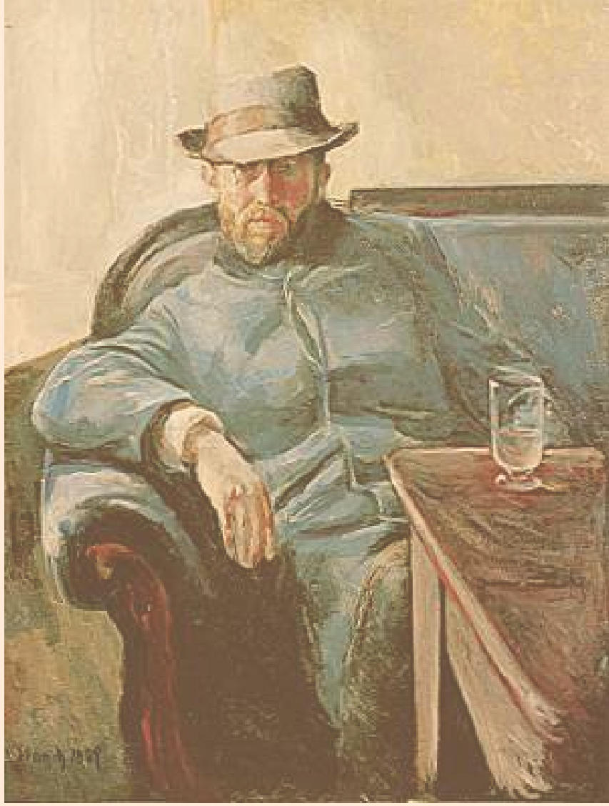
Edvard Munch: Fra Christiania bohemen 1907 © Munch-museet / Munch-Ellingsen gruppen / BONO 2010 Foto: © Munch-museet (etter direkte avtale med museet)