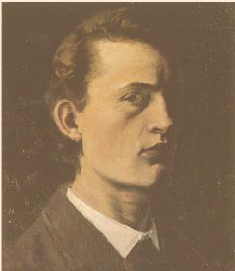
Edvard Munch: selvportrett 1881 © Munch-museet / Munch-Ellingsen gruppen / BONO 2010 Foto: © Munch-museet (etter direkte avtale med museet)

THELONIOUS MONK ARNE HIORTH VIDAR JOHANSEN GUTTORM GUTTORMSEN RUNE NICO EDVARD MUNCH